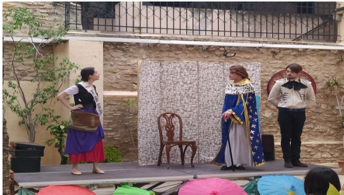
EL TRAJE NUEVO DEL EMPERADOR

Propuesta de 4 cuentos clásicos escenificados (duración aproximada de 15/20 min cada uno). Se recomienda un circuito completo con los 4 microteatros, por la moraleja que se lanza en cada uno de ellos y su calidad interpretativa. Ideal para todas las edades. Posibilidad de teatralizar cuentos por separado.