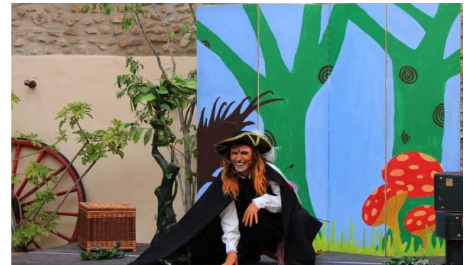
EL GATO CON BOTAS